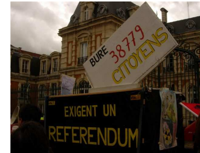
Un fort engagement citoyen