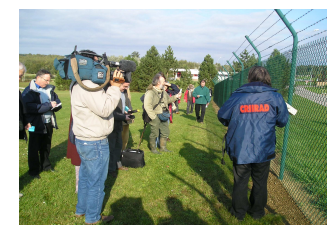
Transports atomiques, poubelle de Soulaines ...