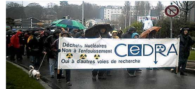
Se faire entendre, partout et par tous les temps