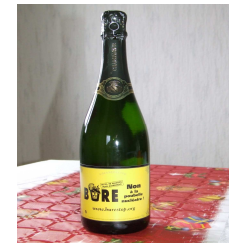
Défendre les terroirs et l'avenir